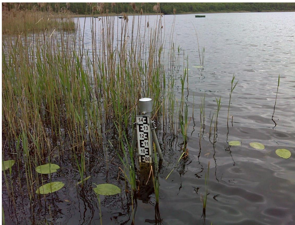
Fot. 1 Przykładowy sposób montażu łąty wodowskazowej z piezometrem do pomiarów stanów wody w jeziorze.